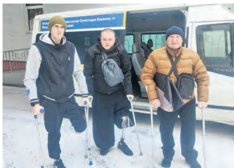
„Wings of Victory“ fährt arm- und beinamputierte Veteranen regelmässig zur Schwimm- und Reittherapie.