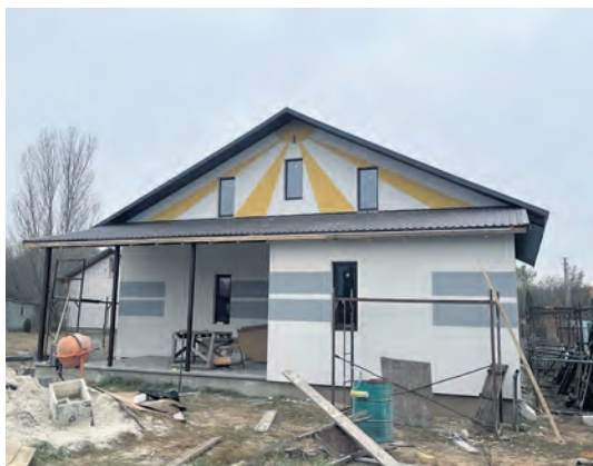
Ein Lichtblick in dunkler Zeit: das neu erbaute „Haus der Freunde“ in Chotjaniwka.

und Sicherheit zu vermitteln. 2025 konnte die Stiftung ihre Treffen mit den Kindern dieser Familien deutlich ausweiten. So gibt es nun neben kunsttherapeutischen und handwerklichen Kursen auch Englischklassen für Interessierte. Ausserdem können Kinder Unterricht in christlicher Ethik besuchen.