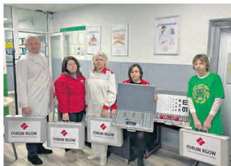
Forum RGOW hat „Förderung der Medizin“ bei der Beschaffung von Instrumenten zur Augenheilkunde unterstützt.

Gebieten der Zentralukraine mit kostenloser medizinischer Unterstützung zur Seite. In die Zentralukraine sind vor dem Krieg im Osten und Süden des Landes besonders viele Familien geflüchtet, die sich die Lebenshaltungskosten in den Städten nicht leisten können. In manchen Ortschaften ist dadurch die Bevölkerung um 60 Prozent gewachsen. Das vor dem russischen Angriffskrieg bestehende ukrainische Hausarztssystem ist jedoch in den ländlichen Gebieten grösstenteils zusammengebrochen, da viele Ärzte in die Armee eingezogen wurden oder in den Städten arbeiten. Die freiwilligen Ärzte von „Förderung der Medizin“ sind daher die einzigen, die für die Menschen in ländlichen Regionen der Zentralukraine kostenlose medizinische Konsultationen anbieten. Zwei Gesundheitsbusse mit mobilen ärztlichen Teams unterstützen jährlich etwa 80000 Patienten. Die medizinischen Untersuchungen vor Ort werden in Zusammenarbeit mit lokalen Behörden, gemeinnützigen Organisationen und medizinischen Einrichtungen durchgeführt. Zusätzlich betreibt die Stiftung in der Region Kyjiw zwei stationäre Einrichtungen. Besondere Aufmerksamkeit richtet „Förderung der Medizin“ auf die Prävention, Früherkennung und Operation