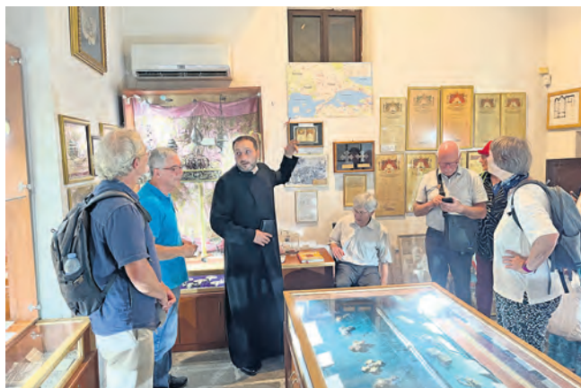
Zu Besuch bei der armenischen Gemeinde in Plovdiv.